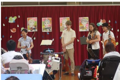
特別支援学校でのコンサート