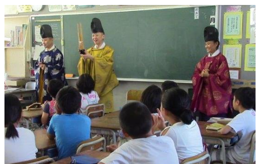
クラス訪問（低学年）