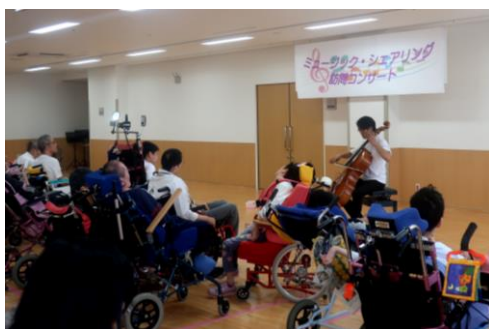
病院内でのコンサート