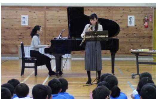
体育館でのコンサート

【その他】 子どもたちに司会進行やコンサートスタッフとして、演奏家をエスコートする係などのお手伝いをお願いしています。また、子どもたちの集中力を高めるため、保護者の皆様の参加はお断りしております。