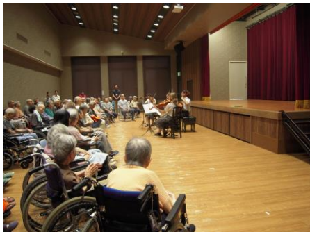
施設内でのコンサート