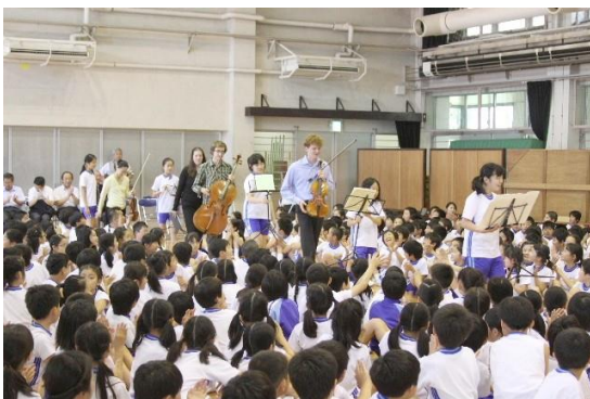
演奏家のエスコート係を務める児童

http://www.musicsharing.jp/activity/concert/index.html