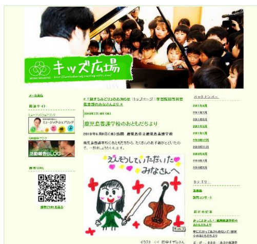
子どもたちからの感想文掲載サイト「キッズ広場」 http://musicsharing.cocolog-nifty.com/kids/

訪問コンサート終了後、子どもたちの感想文や、当日撮影した写真などをご提供ください。当法人ホームページの「キッズ広場」、「ICEP ブログ」、「活動ブログ」、報告書など当法人印刷物への掲載、また新聞・雑誌といったマスコミなど外部へ資料として提供する場合があります。あらかじめご了承ください、公表不可のものがあれば事前にお知らせください（部分的にぼかすことも可能です）。