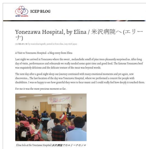
6月の活動の様子を伝える「ICEP ブログ」 https://musicsharingweb.wordpress.com/